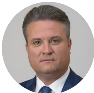
Вадим Юрьевич Кстенин Глава городского округа город Воронеж

Желаю всем участникам выставки достижения поставленных целей и плодотворного сотрудничества!